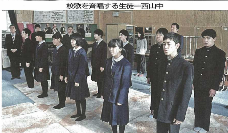
校歌を斉唱する生徒—西山中

「会津から離れて仕事をしたい。文を書くのが好きだから、文を書く仕事に就きたい。」と中学校の時に話していた生徒さんだったそうです。報じていただいたこともうれしいですが、中学校時代に抱いていた夢を実現した記者さんにお会いできたことも大変うれしい出来事でした。本校生徒の将来も楽しみです。