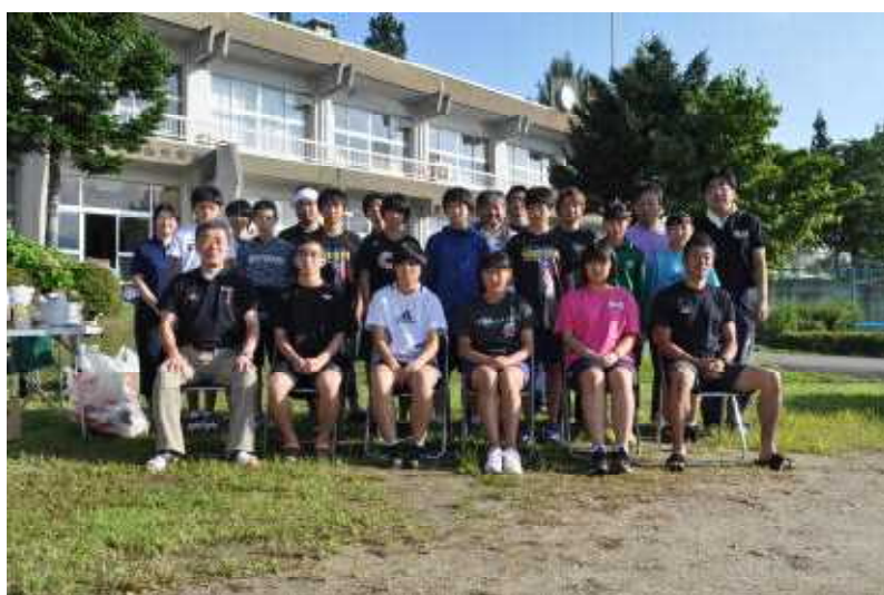
39年間ありがとう！西山中学校校舎

西山中学校の現校舎は、昭和53年から使用しており、39年間にわたり、多くの同窓生の心のよりどころとなりました。今年度いっばいで閉校ということもあり、PTAの方々の全面的なご協力で実施することができました。最初で最後の機会ということもあり、参加者を現高校生まで拡大し、楽しく行うことができました。