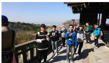
清水寺にて…桜満開