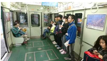
電車で緊張する4人…(*^_^*)