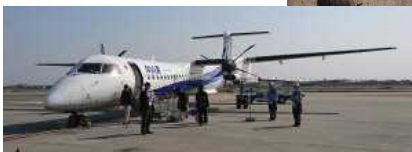
名機 ボンバルディア