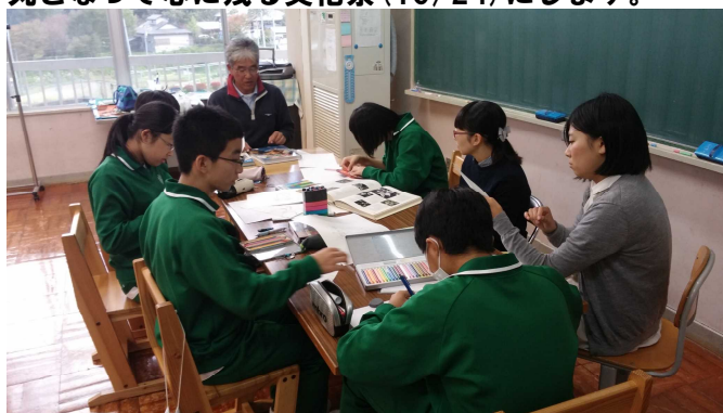
文化祭の準備も着々と進んでいます