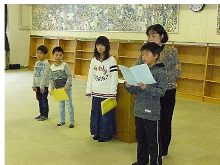
大きな声で、上手に発表できました！

今学期も、いろいろな面から子どもたちの成長を見守り、応援していきたいと思いますので、保護者の皆様におかれましてもこれまで同様のご協力、ご支援の程よろしくお願い申し上げます。