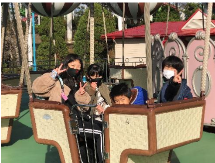
<ベニーランドを満喫>