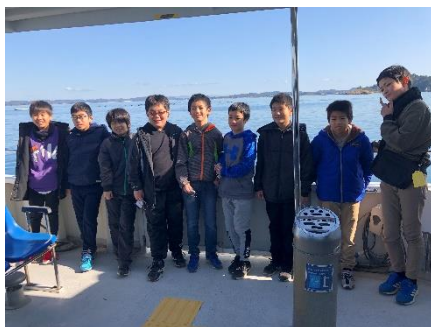
<最高の景色・遊覧船にて>