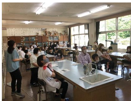
< 2年生 >