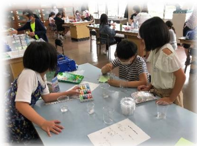
<ものづくりクラブ>