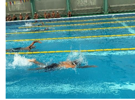
< 6年生 >