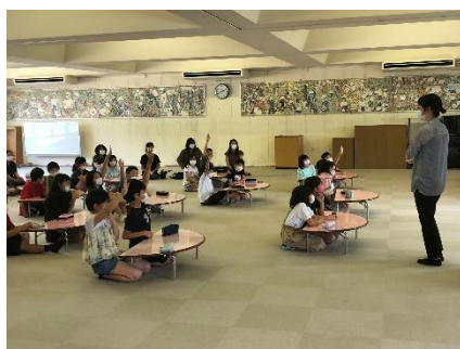
< 4年生 >