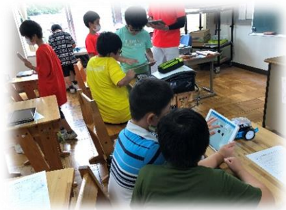
<パソコン・プログラミングクラブ>