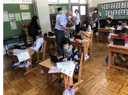
< 5年生 >