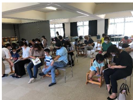
< 1年生 >

また、放送でお話させていただいたとおり、今後の教育活動におきましても、感染防止の観点から日程や内容を変更させていただくこともございますが、ご理解、ご協力いただければと思います。